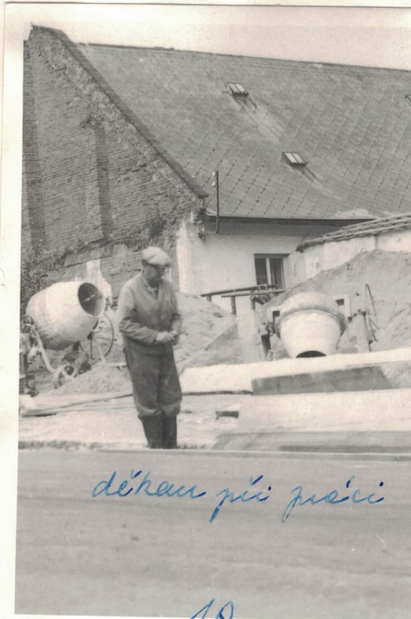
děkan při práci