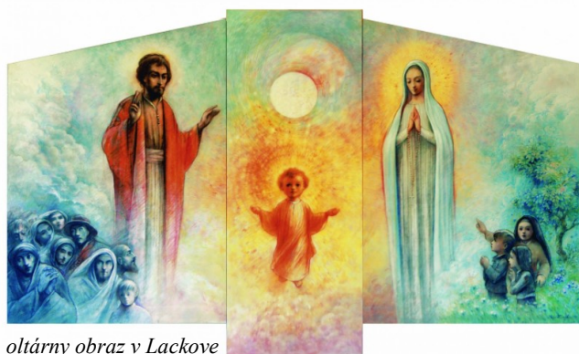
oltárny obraz v Lackove

upúta nielen svojou stavbou, ktorej dominuje vysoká veža – zvonica, ale i nevšedným oltárnym obrazom. Jeho námetom bol zázrak z 13. októbra 1917 opisovaný v knihe Fatima – Mária hovorí svetu. Vtedy sa asi 70 000 pútnikom, zjavila Svätá rodina: Panna Mária, sv. Jozef i Dieťa Ježiš.